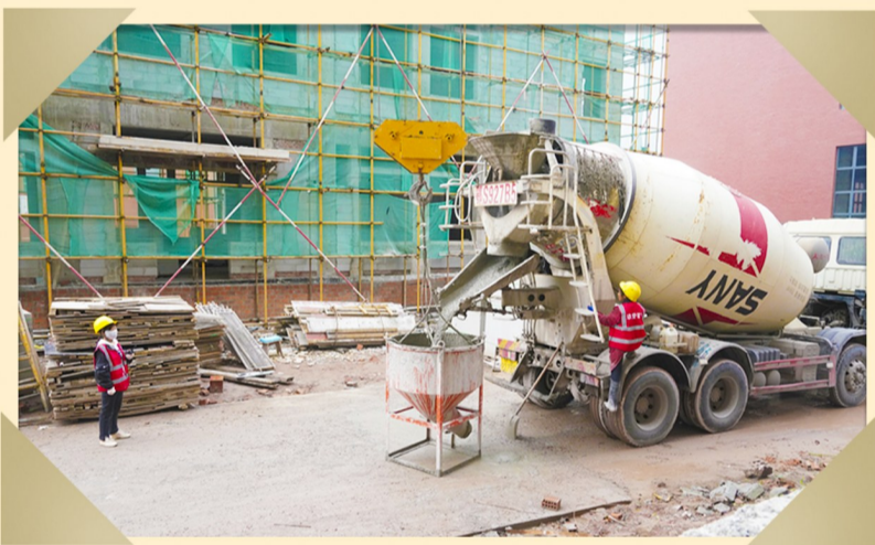
5月2日,施工人员正在运输水泥。