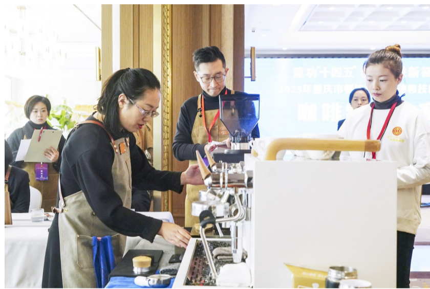
参赛选手进行咖啡制作项目的比拼。

本报讯(记者 彭浩杰 文/图)11月17日,由重庆市总工会、中共北碚区委、北碚区人民政府共同主办,市总工