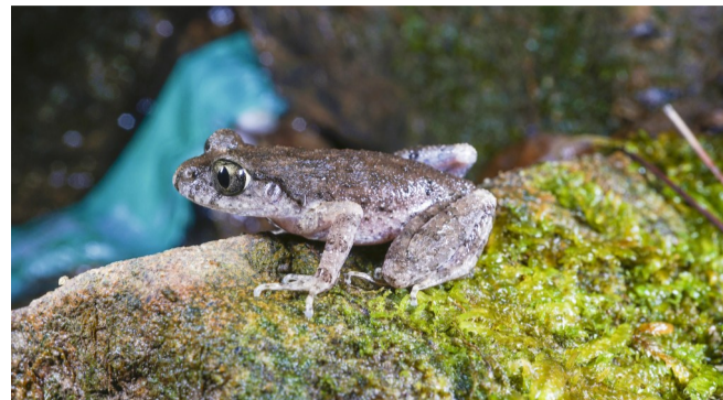
缙云掌突蟾

本报讯(记者 田济中)日前,记者从区文化旅游委获悉,经过长期的野外调查、形态及数据分析后,中国科学院成都生物研究所、重庆自然博物馆及贵州大学等单位的研究人员在缙云山共同发现掌突蟾属一新种——缙云掌突蟾,这是缙云山首次发现两栖动物新种。