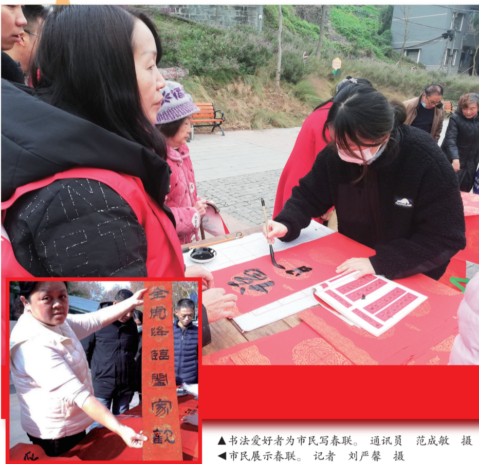
▲书法爱好者为市民写春联。 ▲市民展示春联。

本报讯(记者 刘严馨)1月18日,天生街道、区美术馆、区图书馆联合开展“迎新春·送春联”志愿服务活动,来自我区书法家协会的书法家现场免费为市民写春联送祝福。