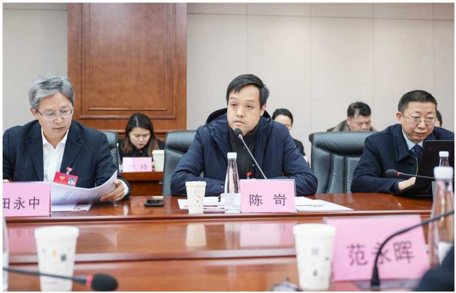
2月27日,参加区政协十六届三次会议的区政协委员正在发言。

本报讯(记者 代宇航 文/图)2月27日,参加区政协十六届三次会议的区政协委员就政府工作报告进行协商讨论。