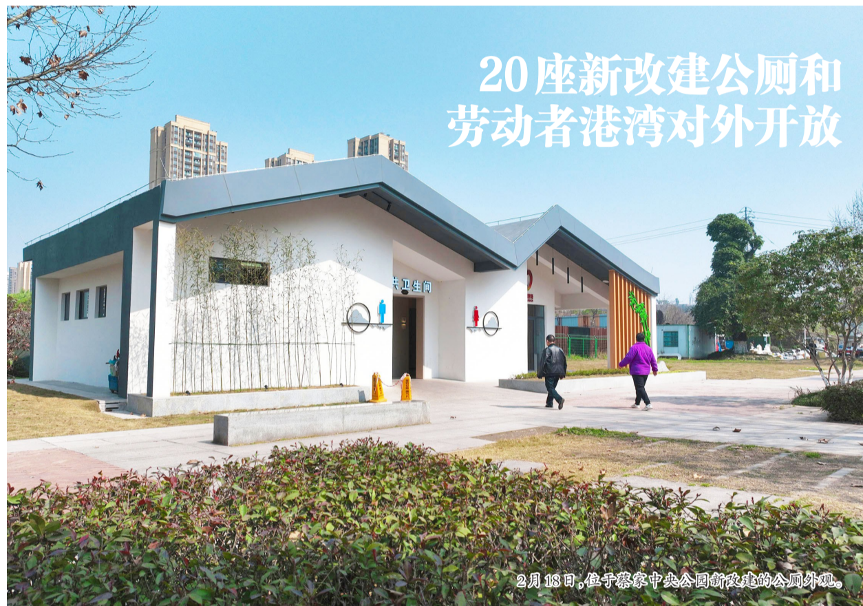
2月18日，位于蔡家中央公园新建的公厕外观。