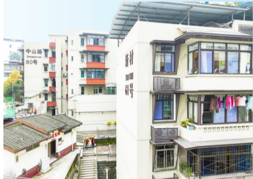
天生街道泉外园社区主体改造接近尾声。