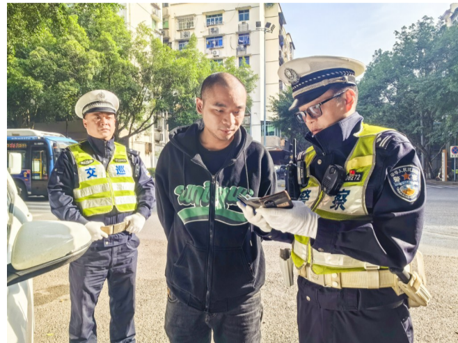
11月20日，区公安分局交巡警支队民警在龙溪路路段开展交通违法行为检查。

本报讯(记者 刘洪滔文/图)连日来，区公安分局交巡警支队结合辖区交通安全形势，扎实开展冬季交通安全突出违法行为专项整治行动，严查各类道路交通重点违法行为，防范化解突出安全隐患。