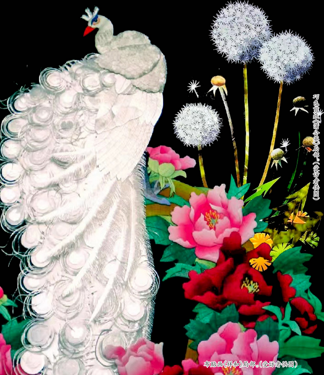
布贴画《祥和》局部。