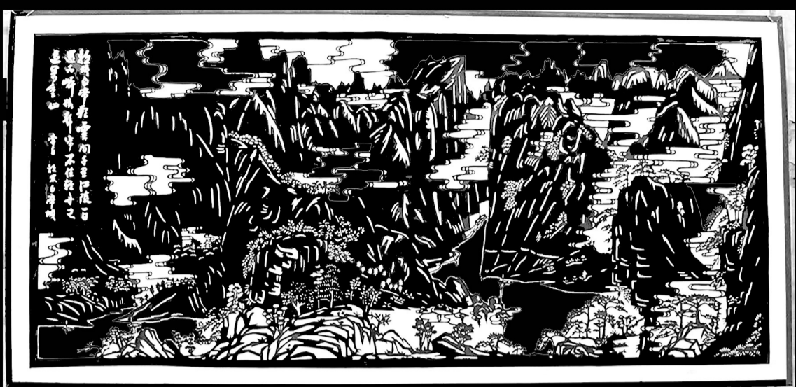
剪纸《三峡神韵》。

纸袋里装着她对世界的倾诉。一手剪纸,一手布艺,是她的平生所爱。能够把时间花在感兴趣的事上,在她看来,便是最意义的人生。