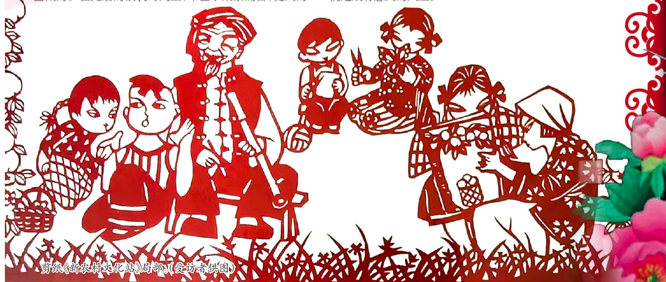
剪纸《新农村文化》局部。