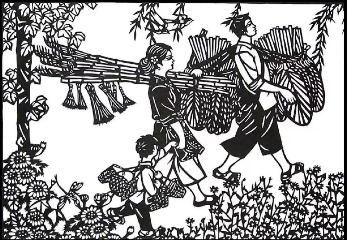
剪纸《瞧这一家子》。(受访者供图)