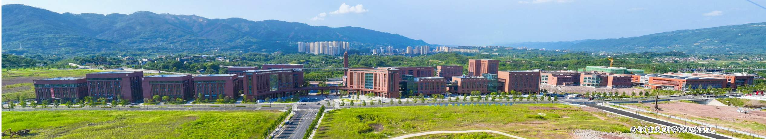
西部(重庆)科学城北碚园区。