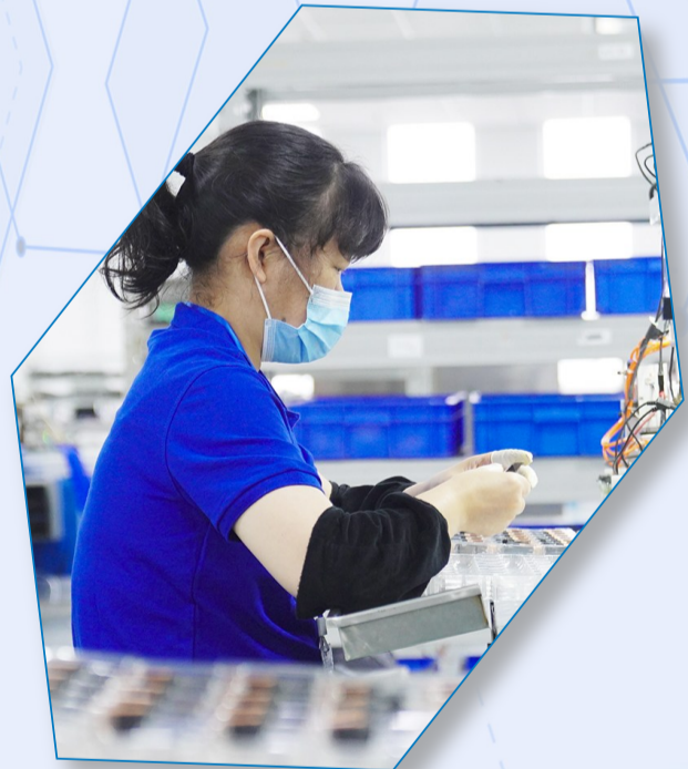
重庆华虹仪表有限公司,员工正在生产线忙碌。