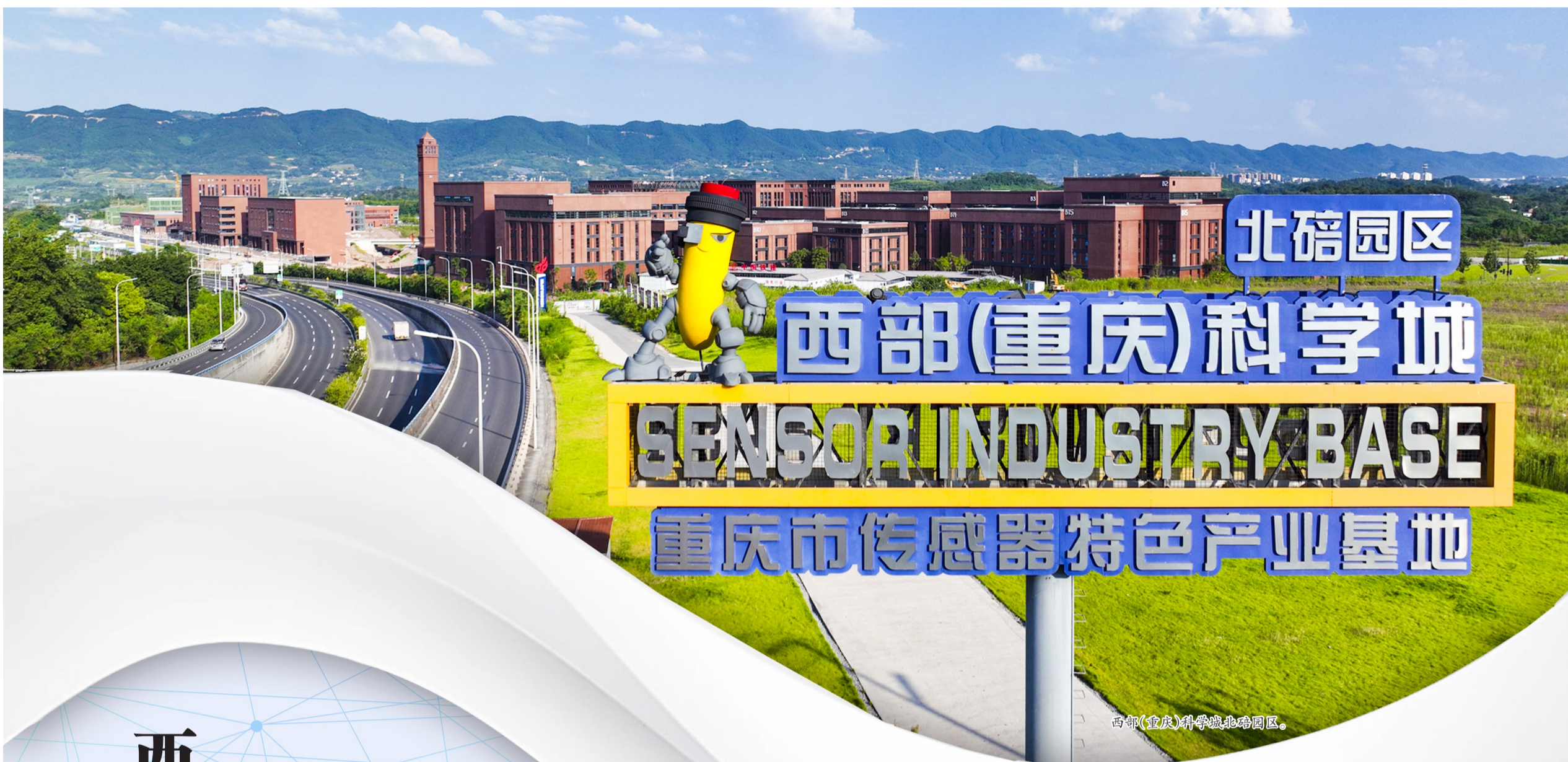
西部(重庆)科学城北碚园区。