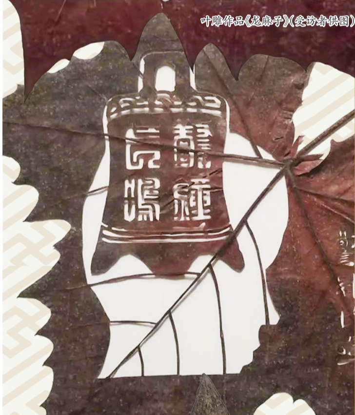
叶雕作品《警钟长鸣》