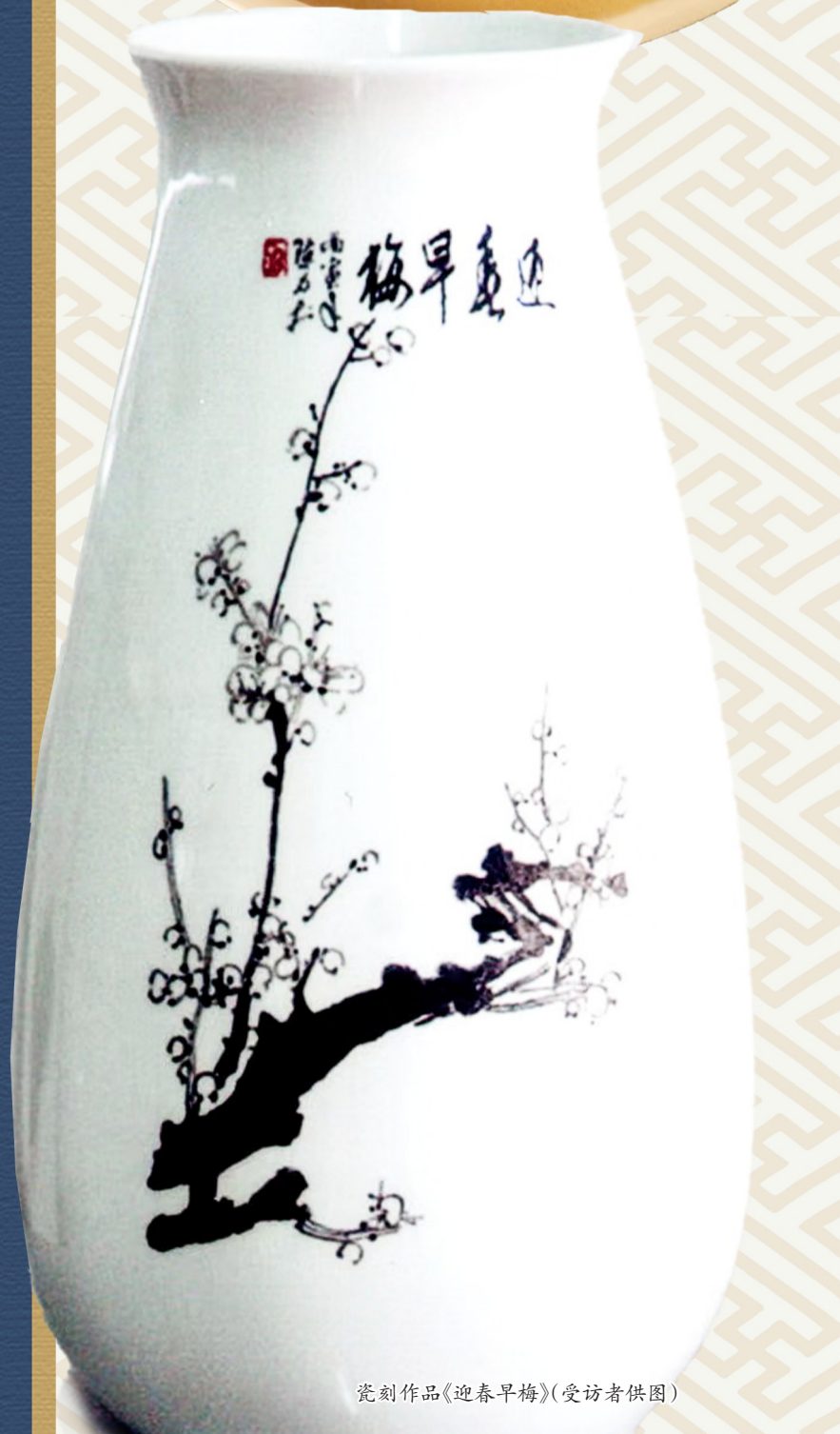
瓷刻作品《迎春早梅》