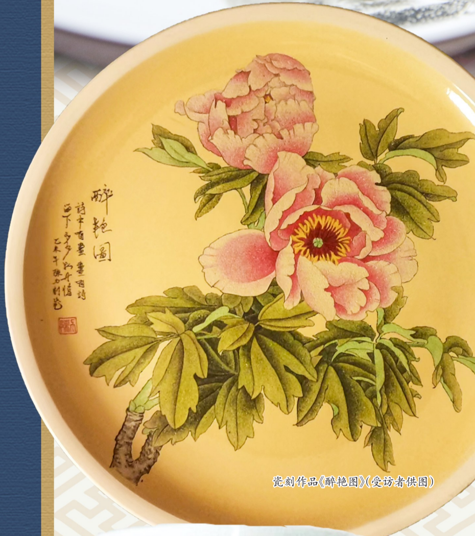
瓷刻作品《醉艳图》