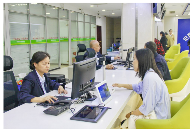
10月10日,市民办理社保卡补(换)业务。

本报讯(记者 罗丹文/图)近日,记者从区人社局获悉,10月7日起,在我区所有人社网点和合作银行网点补(换)社保卡,均免收25元工本费,预计全年将减少群众办卡费70余万元,真正把便民、利民、惠民工作落到实处。