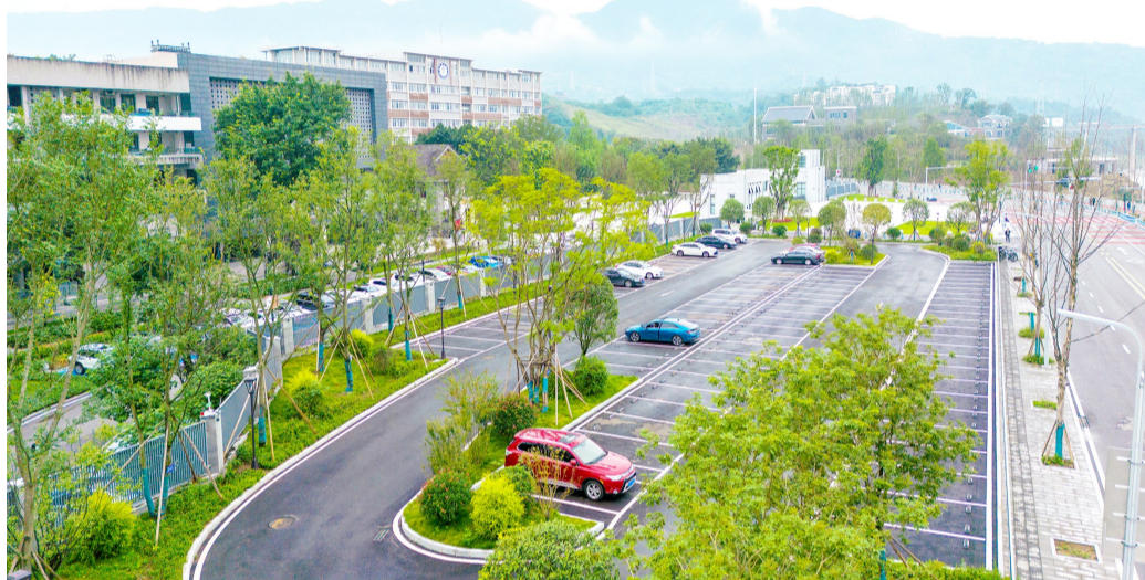
滨江4号小微停车场

滨江4号小微停车场的建成投用,只是我区全力推进小微停车场建设,缓解停车难问题的一个缩影。今年以来,区城市管理局开足马力,在老旧小区、老校区、老医院、老商圈等区域,利用城市边角地块、闲置用地建设小微停车场,着力解决“四老区域”停车难问题。截至今年9月,我区已在“四老区域”建成小微停车场14个,新增公共泊位1300余个。下一步,我区将继续利用部分城市零星用地、闲置用地、桥下空间等地块,建设便民小微停车场。