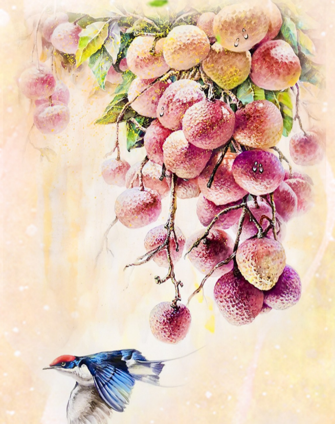
《红荔飘香》 曾伊全 / 水彩画

看过无数老电影，三天三夜也说不完。老电影的魅力是超越时代的，有一句话说得特别好：电影是时间的形状，而好电影可以解放时间！