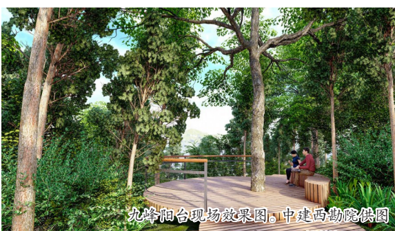
九峰阳台现场效果图。中建西勘院供图