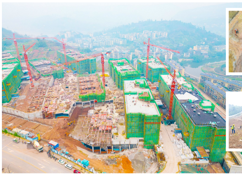
温泉谷安置房三期项目施工现场。