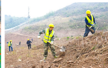
缙岭麓泉项目施工现场。

本报讯(记者 代宇航 文/图)新年伊始,文旅公司多个重点项目均开足马力,忙建设、抢进度。2月8日,记者在走访温泉谷安置房三期项目、澄江污水处理厂项目、缙岭麓泉项目时看到,现场处处呈现出热火朝天的忙碌景象,吹响了高质量发展的“冲锋号”。