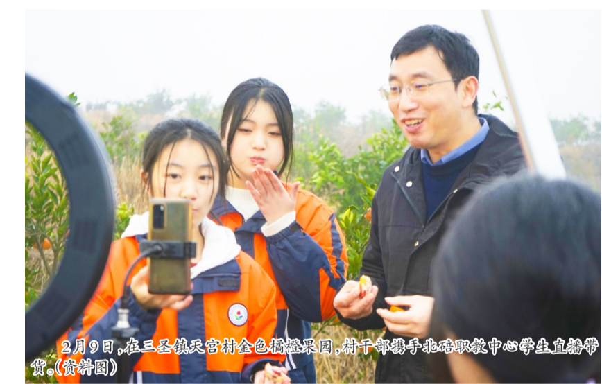
2月9日,在三圣镇天宫村金色橘橙果园,村干部携手北碚职教中心学生直播带货。(资料图)

天宫电商发展体系搭建以来已开展多场直播带货活动,帮助村民销售水果、蔬菜、蜂蜜等农产品及竹编工艺品。自去年11月柑橘类水果进入成熟期以来,已先后帮助村民销售爱媛、青秋、大雅、血橙、胭脂橙等水果6万余斤,销售收入30余万元。