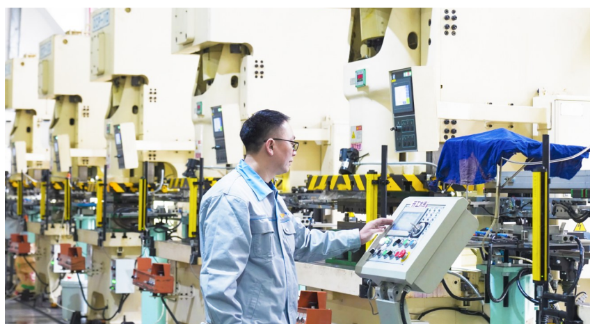
嘉泰罗光电科技有限公司的工人在生产车间忙碌