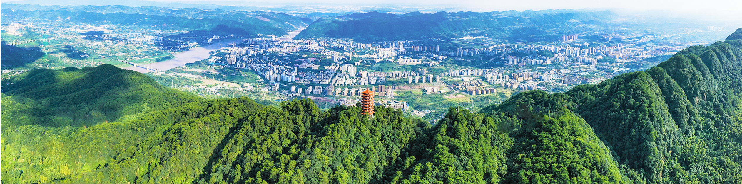
缙云山下北碚城区

学习贯彻党的二十大精神，关键看行动、最终看效果。对北碚区来说，就是要以党的二十大精神为指引，深入学习贯彻市委六届二次全会精神，主动把全区工作放到中国式现代化的宏大场景中谋划，围绕“新时代、新征程、新重庆”加快推进。 当前，按照市委、市政府的部署要求，北碚区聚焦生态田园都市区、人文科教创新城“两大定位”，做好生态人文、科技创新、民营经济、城乡融合“四篇文章”，推动目标任务再优化、再完善，工作措施再细化、再精准，为新时代新征程全面建设社会主义现代化美丽北碚而团结奋斗。