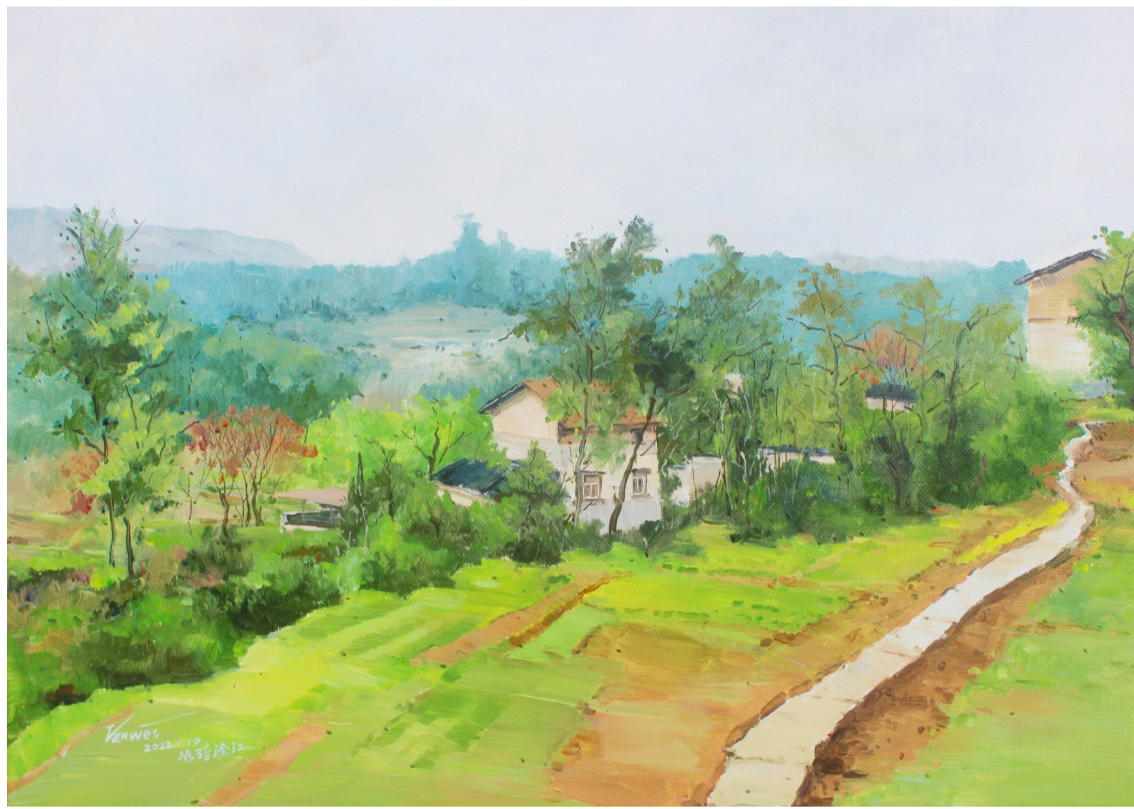
《山村暖冬》 范炜/布面丙烯