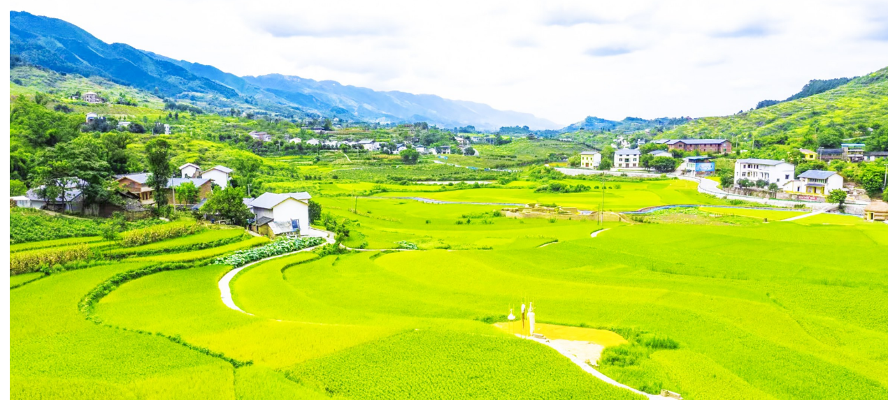
“中国美丽休闲乡村”柳荫镇东升村(资料图)