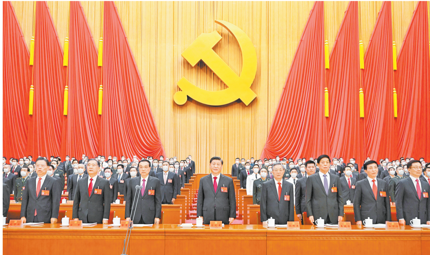
10月16日,中国共产党第二十次全国代表大会在北京人民大会堂开幕。这是习近平、李克强、栗战书、汪洋、王沪宁、赵乐际、韩正、胡锦涛在主席台上。

新华社北京10月16日电 凝心聚力擘画复兴新蓝图,团结奋进创造历史新伟业。举世瞩目的中国共产党第二十次全国代表大会16日上午在人民大会堂开幕。