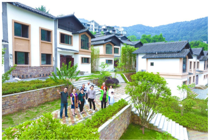
澄江镇北泉村“缙云山居”生态迁建房(资料图)