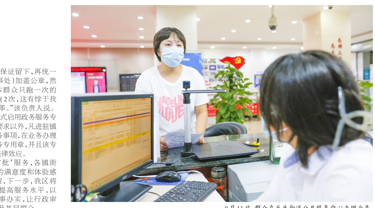
8月11日,群众在天生街道公共服务中心办理业务。

作人员只得将低保户的低保证留下,再统一拿到镇人民政府(街道办事处)加盖公章,然后通知群众来领取。“原本群众只跑一次的业务,因为公章原因需要跑2次,这有悖于我们提倡的‘最多跑一次’改革。”该负责人说。 对此,今年5月,我区正式启用政务服务专用章,除法律、法规有特殊要求以外,凡进驻镇街公共服务中心的政务服务事项,在业务办理过程中均统一加盖政务服务专用章,并且该专用章与镇街公章具有同等法律效力。 “通过‘一枚印章管审批’服务,各镇街的工作效率提高了,群众的满意度和体验感也提升了。”该负责人介绍,下一步,我区将继续优化办事流程,不断提高服务水平,以实际行动把好事办好、实事办实,让行政审批制度改革的红利真正惠及基层群众。