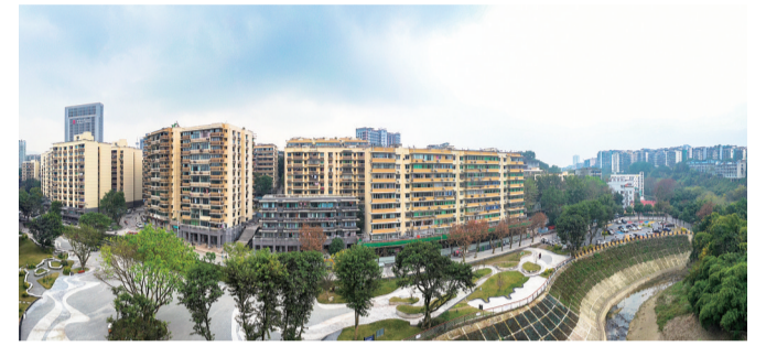
改造后的新房子社区。(资料图)

主持人:朝阳街道新房子社区经过老旧小区改造后,不论是居住条件还是周边环境,都有了很大的变化。这项民生实事,正是由缙云公司实施的吧?