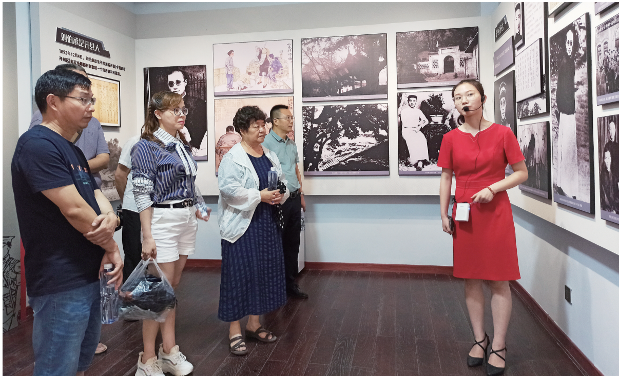
诗人、作家们在中共中央西南局旧址采风。

当天,诗人、作家们通过实地走访金刚碑、缙云寺、黛湖、中共中央西南局旧址等地,深入了解北碚的自然风光与历史文化,感受北碚的独特魅力,以积累创作素材。