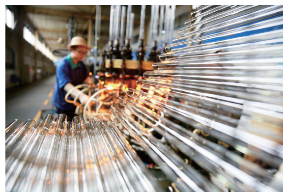
一名工人在正川医药包装材料股份有限公司制瓶车间辛勤忙碌着。