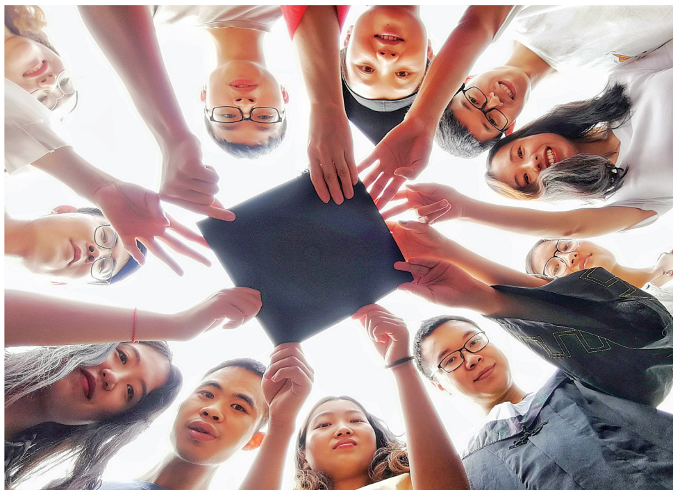
几名西南大学学生拍摄毕业照。

6月18日,北碚区摄影家协会的40多名会员参加了“我爱重庆精彩一日”百万市民拍重庆主题摄影活动,这是由重庆日报、重庆摄影家协会举办的庆祝新中国成立70周年系列影像活动的首个线下活动。大家深入学校、企业、农村拍摄精彩瞬间,展现我区日新月异的发展新成就、新面貌。今天,本报向你展示,北碚的一天有多精彩。