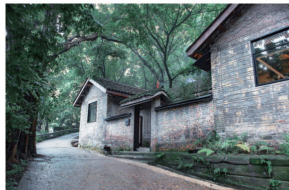
建设中的金刚碑。