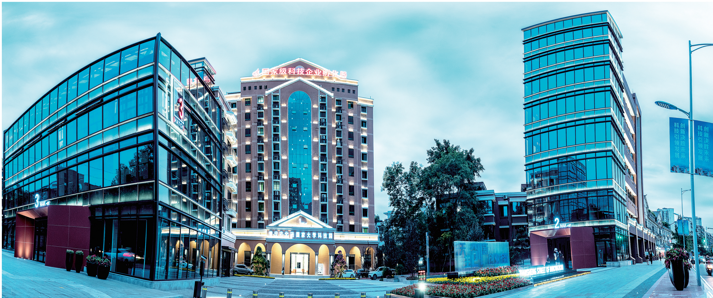
西南大学(重庆)产业技术研究院。