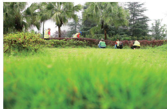
几名绿化工人在碚南大道绿化带清理杂草。