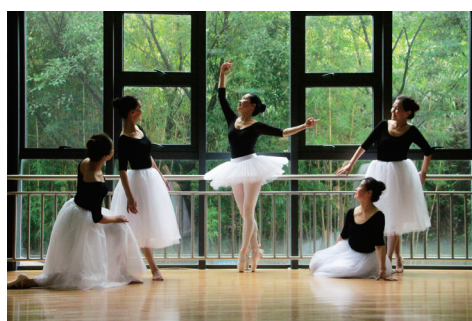
几名芭蕾舞爱好者在北碚老年大学舞蹈教室内练舞。