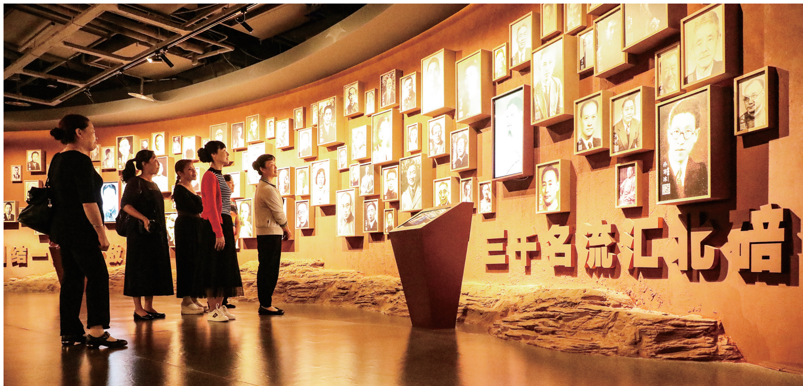
市民参观北碚历史文化陈列馆,了解北碚往事。