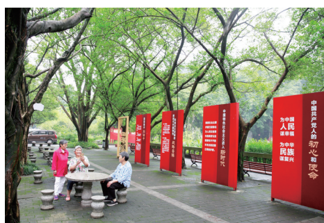
几名老人在龙凤桥街道的龙凤党建微公园休憩。