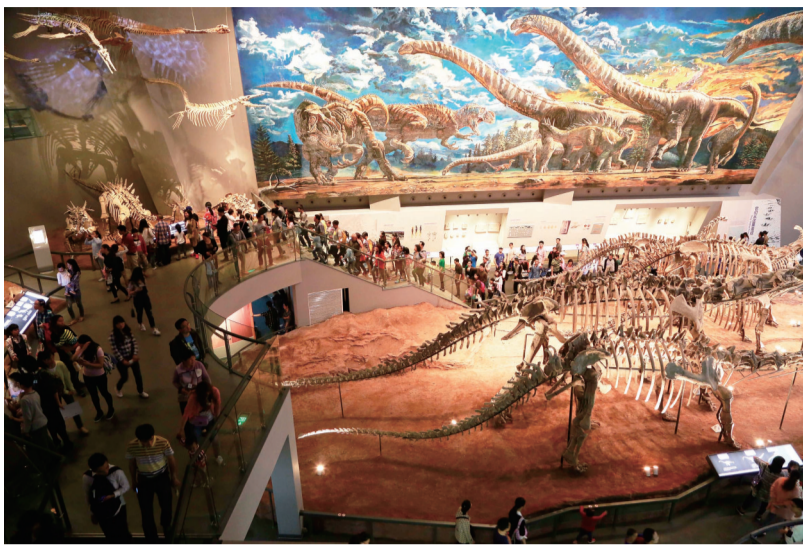
游客在重庆自然博物馆恐龙厅参观。