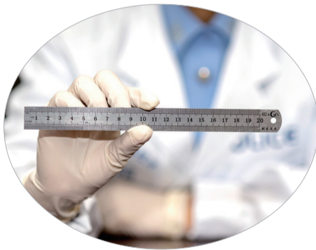
祁麟展示量伤的尺子。