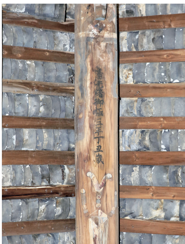
祠堂顶梁上写着修建时间。