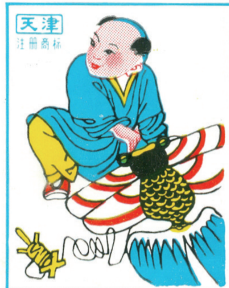
放风筝(火花)