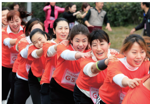
“毛毛虫竞走”趣味游戏