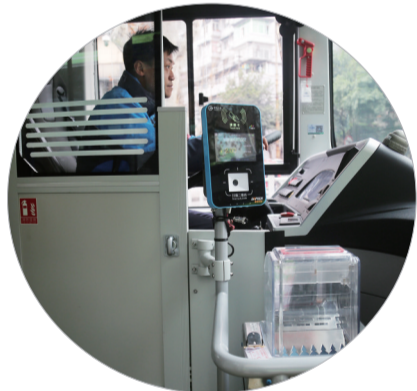
驾驶室防护隔离门

边还设有呼叫器。此外,上下车门处均设置了无障碍折叠坡道,打开后,轮椅、婴幼儿推车等可平稳地上下车。 据重庆北部公共交通有限公司工作人员介绍,该型公交车的车门更宽,踏板更低,更加方便乘客上下车。为保障乘客安全出行,车内还配备了急救箱等应急设施。值得一提的是,驾驶室外特意安装了防护隔离门,防止恶意抢夺方向盘等行为,确保驾驶员行车更加安全。 据了解,目前该公司新引进的36辆新能源中,已有24台投用到515路,6台投用到555路区间线上,剩余6台将陆续投用到520路,为市民提供更加舒适便捷的出行服务。