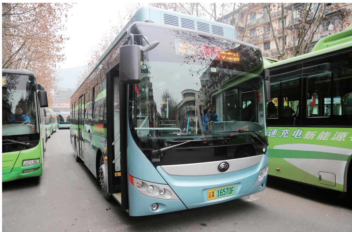
正在候客的515路新能源气电混合客车。