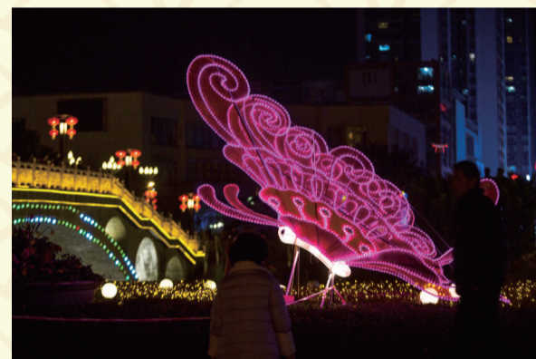
缙云广场“彩蝶纷飞”灯饰。