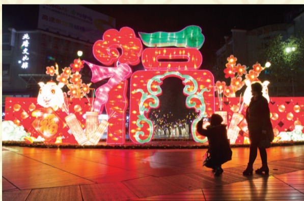
作孚广场“福星高照”灯饰。