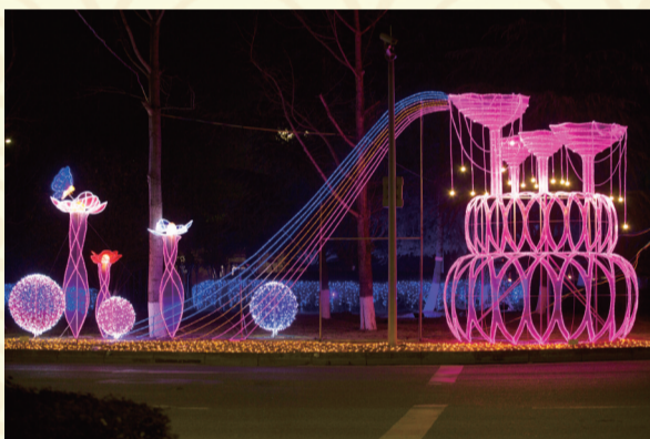
城南状元府第转盘“迎宾酒杯”大型灯饰。