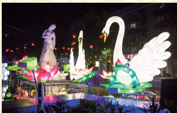
泉外园“天鹅”小型灯饰。