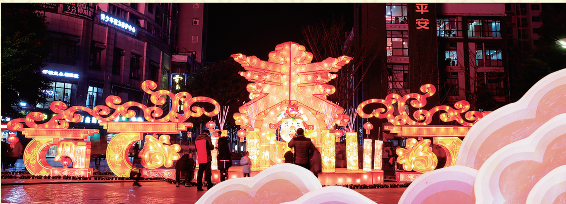
嘉陵风情步行街“福来到”灯饰。