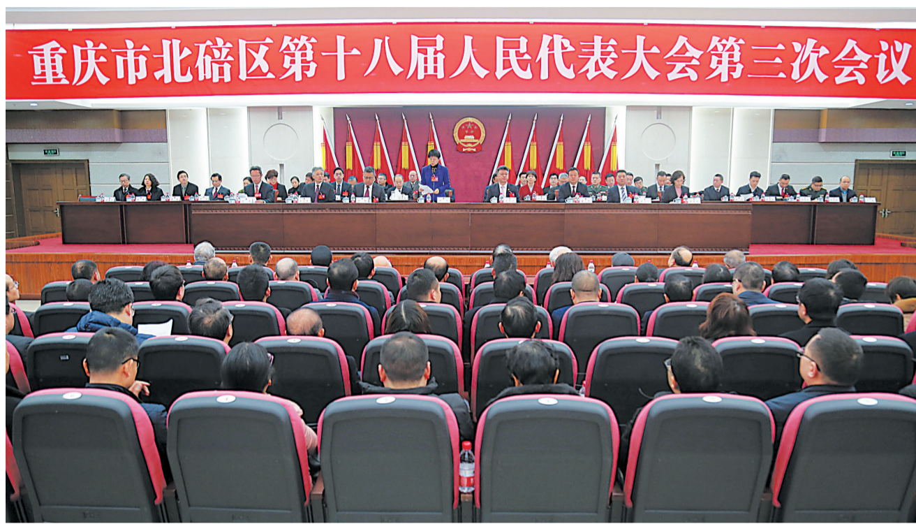
1月17日,区十八届人大三次会议闭幕。