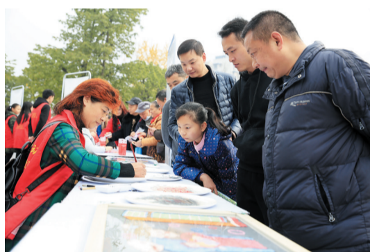
志愿者为市民现场展示篆刻技艺。