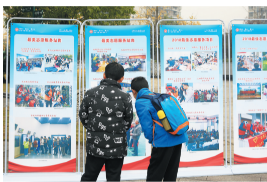
市民在活动现场观看志愿服务先进典型介绍展板。