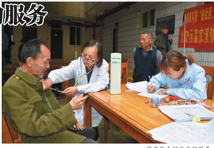
家庭医生到敬老院服务。

“我们力争做到重病大病患者、严重精神障碍患者、低保户、计生特殊家庭、特困老年人等特殊人群家庭医生签约全覆盖。”童家溪镇社事办工作人员表示,该镇不仅将家庭医生签约服务作为一项重要的民生实事来抓,还出资3万元为部分重点服务对象定制“服务包”,开展个性化服务,切实让家庭医生签约服务落到实处。