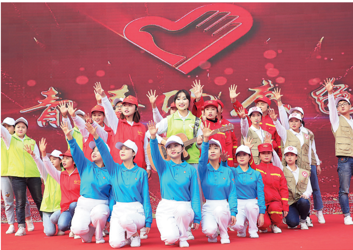
获表彰志愿服务组织在舞台上展示风采。