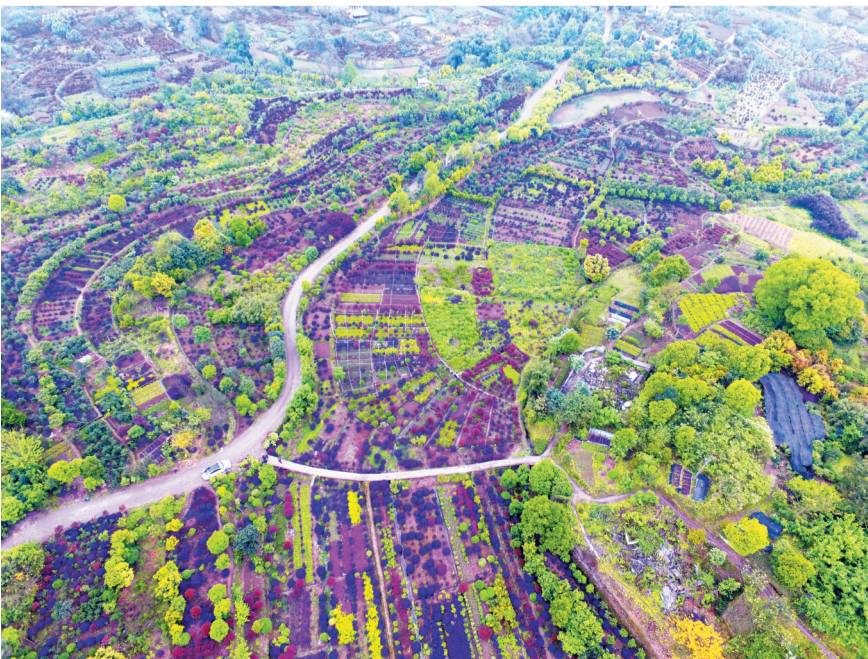
静观镇万全村的苗木基地充满生机。(资料图片)

这个观光体验园名为伴烟翠生态农业园,一期占地约300亩,总投资500余万元,集农业体验、休闲观光、精品民宿等业态为一体,于今年3月建成开放。吉安村以基础设施入股的方式与业主开展合作,在项目中占股10%,每年根据项目利润进行分红。(下转2版)