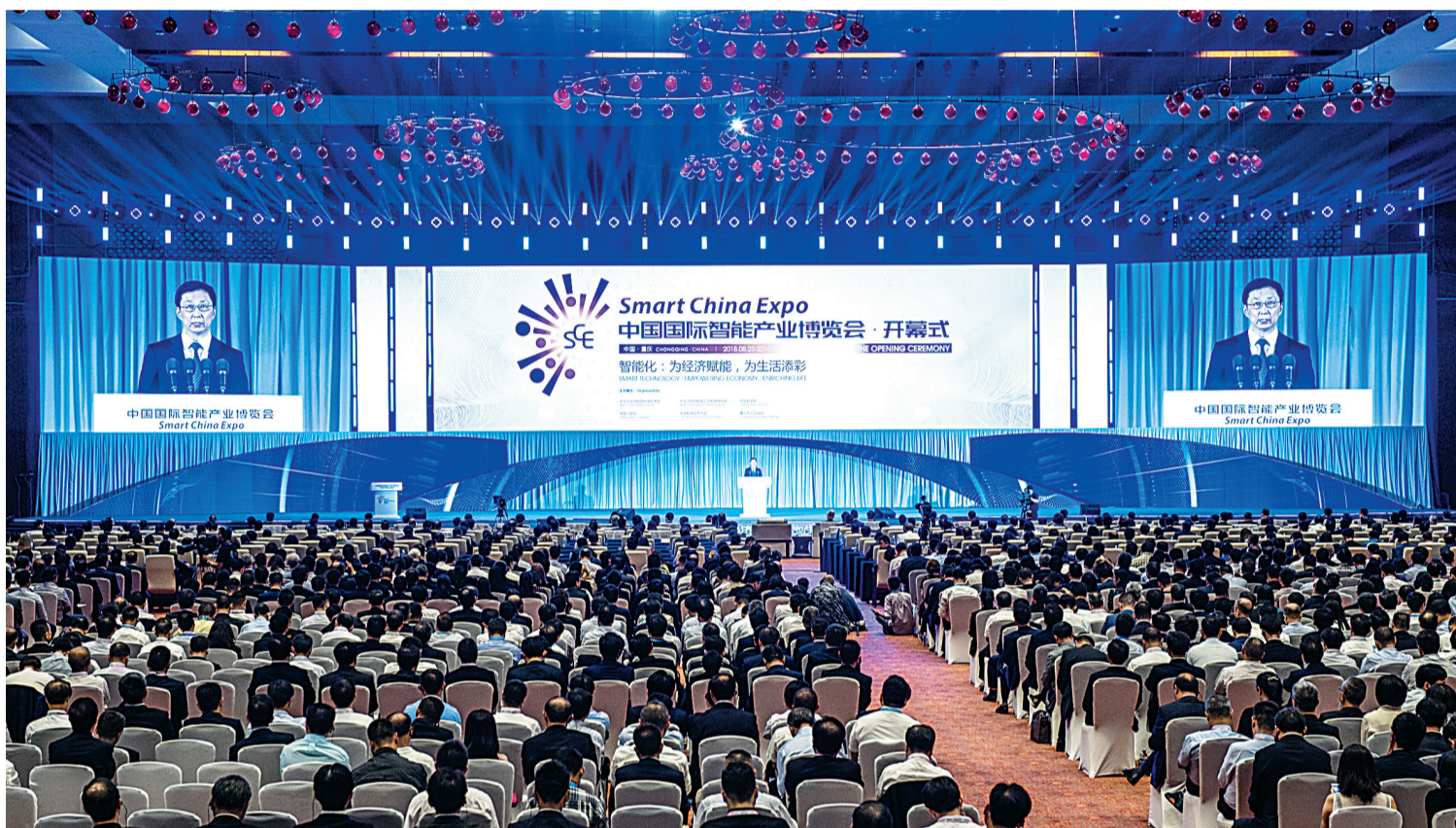
8月23日，首届中国国际智能产业博览会在重庆悦来国际会议中心开幕。图为开幕式现场。

韩正强调，中国经济已由高速增长阶段转向高质量发展阶段。我们要深入贯彻习近平新时代中国特色社会主义思想，把握大数据智能化发展的新特点新趋势，推动智能化在商用、政用、民用领域全面拓展，加快建设智能