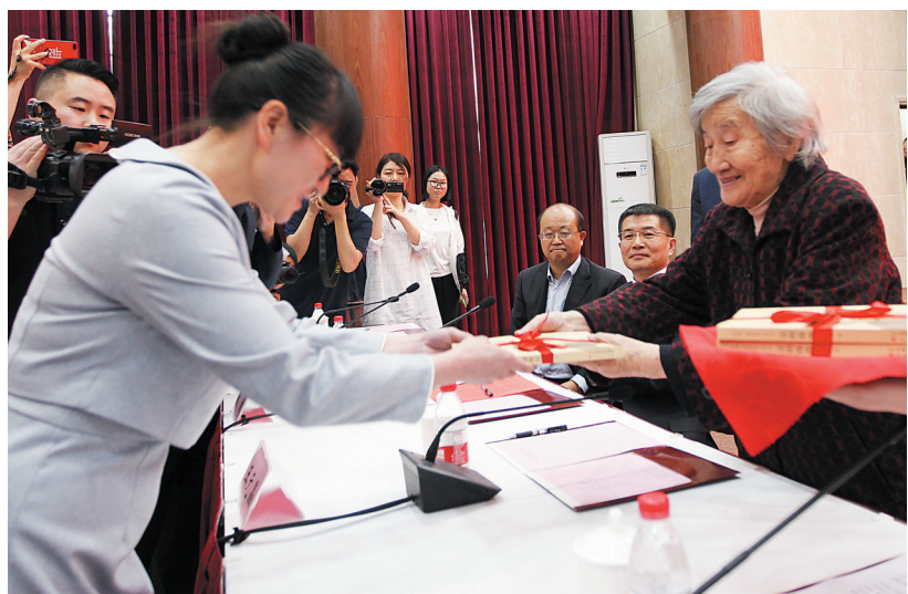
吴明珠院士(右)向同学们赠书。

本报讯(记者 秦廷富 文/图)4月18日,《吴明珠传》首发仪式暨吴明珠院士赠书仪式在西南大学首届校园