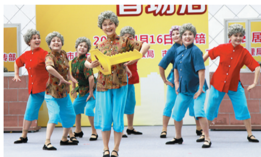
两江名居公租房社区居民自编自演舞蹈《邻里》。