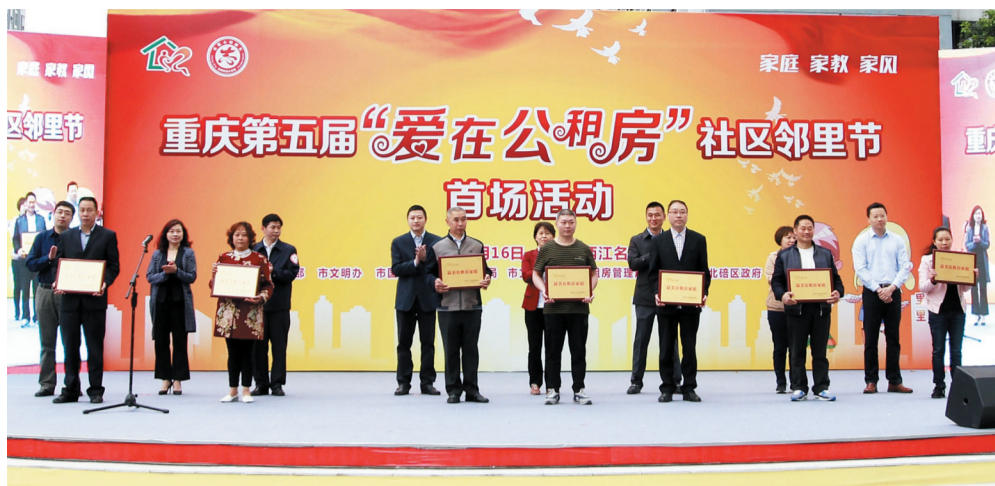
活动向“最美公租房家庭”代表授牌。