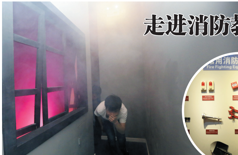
▲企业员工在火灾逃生体验系统体验火场“逃生”。 ▶企业员工了解消防器材的使用方法。