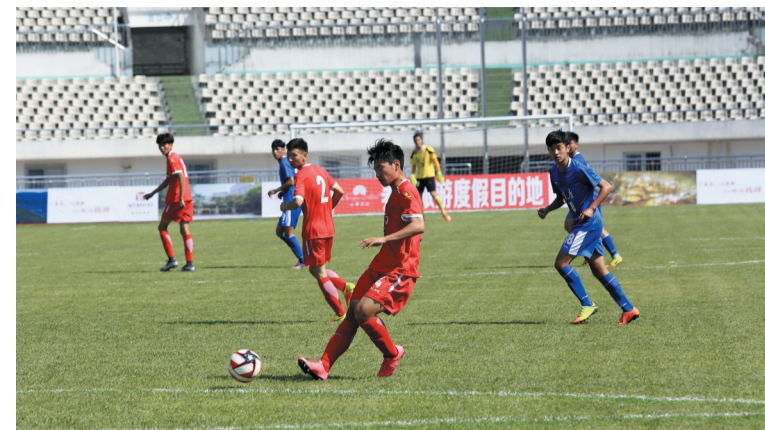
重庆队与河南队交手。

本报讯(记者 秦廷富 文/图)4月14日上午10点,伴随着裁判的一声哨响,第十三届全运会男子足球U18组预赛(重庆赛区)在缙云体育中心拉开序幕,首场比赛重庆队1:4不敌河南队。