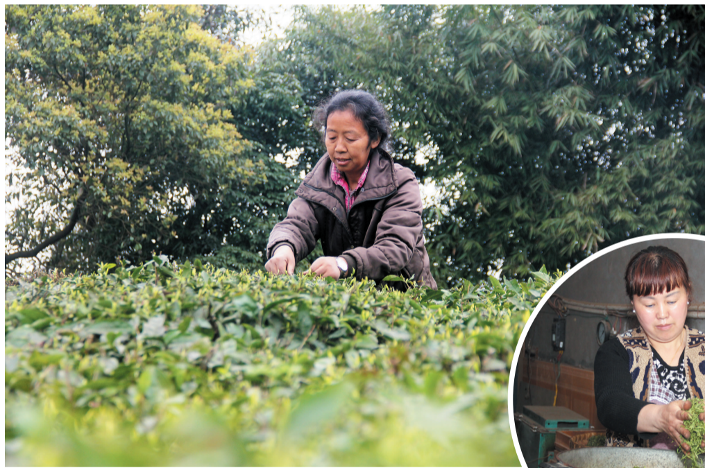
▲茶农趁天晴采摘春茶嫩芽。 ▶工人正在烘制茶叶。