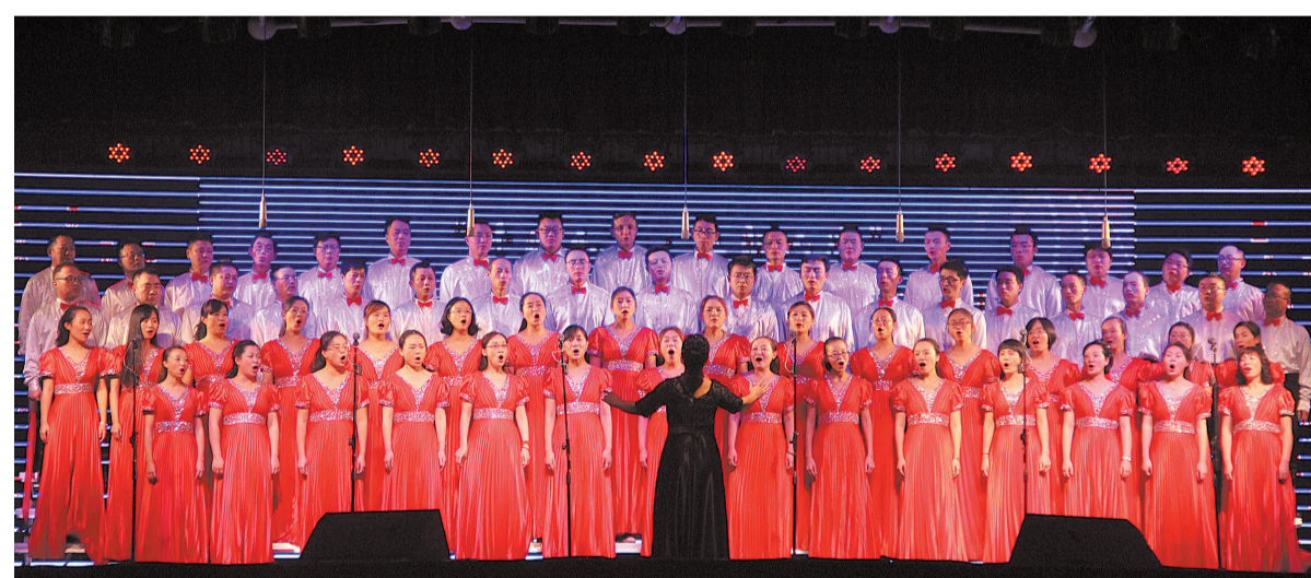
10月31日,第二十四届“缙云之声”合唱赛工会专场在作孚文化广场开唱。

聆听报告后,不少干部职工表示,将以本次宣讲为契机,把学习宣传贯彻全会精神作为当前一项重要工作,加快实施创新驱动发展战略,推动文化体育事业繁荣发展。