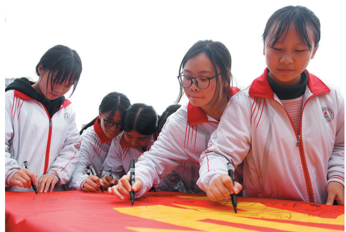
北碚职教中心学生在横幅上签名。

黄宗华表示,签署和践行《公约》,有利于中职学生自我约束、自我管理,为广大学子成长成才、顺利就业、努力创业、成就事业奠定坚实基础。我区将以此次活动为契机,继续坚持教育优先发展战略,加快发展现代中等职业教育,努力培养更多的高素质实用人才,为全市经济社会发展提供强有力的智力支持。